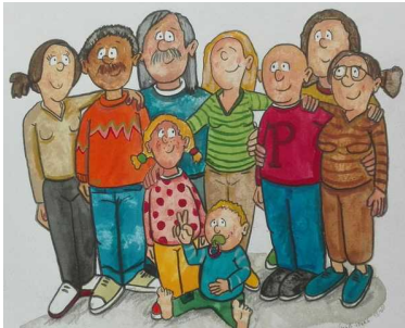
Objekt ID: 127418